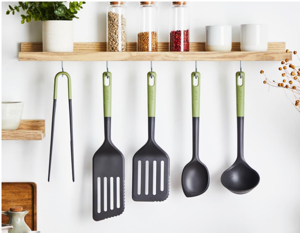
■左から ドレーニング トング、カutting ロングターナー、カutting ターナー、スクレーピング スプーン、メジャリング レードル

「エッセンシャル 2in1」は全部で5アイテム。例えば、ターナーは「炒める」と「カット」の2役ができるようにデザインされていて、ヘラの片側のギザギザ部分で食材をカットできます。レードルは内側に目盛りがついて、調理中の「すくう」と「計る」が一度にできます。スプーンは「混ぜる」と「すくう」がひとつになり、ボウルの側面や鍋の隅まですくいやすい形状になっています。 tongは食材をしっかり挟んで「つかむ」と「湯切り」の2役をこなします。さらに有害物質BPAを含まないので、安心してお使いいただけます。ひとつで複数の役割を果たす「エッセンシャル 2in1」は、料理をおいしく作るのももちろん、調理効率をアップして、洗い物も減らせるので、時短がかなうおすすめのキッチンツールです。