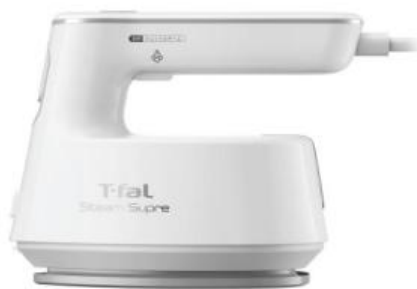
衣類スチーマーとして