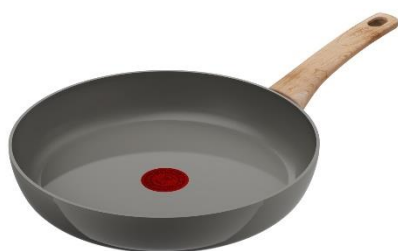
IH セラミックグライド アースグレー フライパン28cm

※2 自社調べ(フランス・ドイツ) N数:100、調査年月:2022-2023年